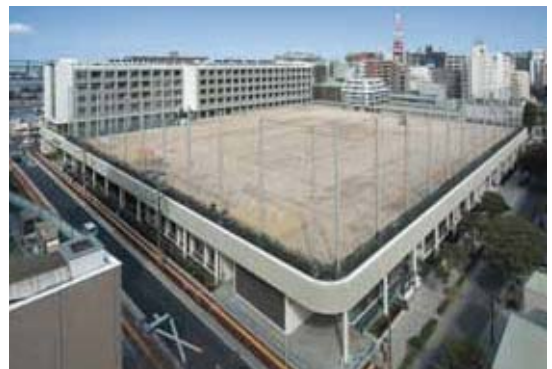
舞鶴小学校・舞鶴中学校

公社は、既存市有建築物の機能を可能な限り長期にわたり有効活用していくため、引き続き計画的な維持保全業務を実施していくとともに、この維持保全業務等を通じて得られるノウハウや知識・技術等の市民や施設管理者等への周知・普及等にも努めていく必要があります。また、福岡市からの建設依頼に基づく学校施設等の整備を行っていく必要があります。