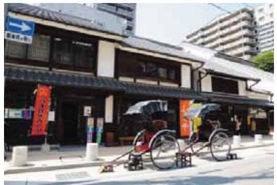
博多町家ふるさと館

事業内容は、市有建築物の修繕・工事等の福岡市からの受託事業をはじめ、計画的な維持保全に関する調査研究等事業や、学校施設等の整備事業を行っています。